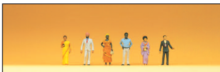
80902 Außereuropäische Reisende Foreign visitors