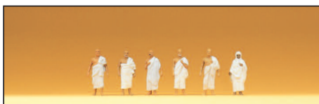
80903 Mekka-Pilger Mecca pilgrims