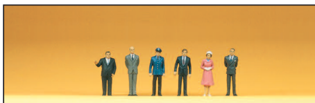
80905 Passanten Passers-by