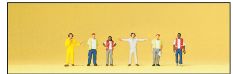
80914 Bodenpersonal Airport personnel