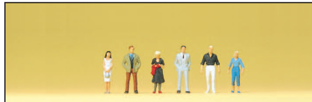
80907 Passanten Passers-by