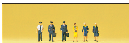
80912 Piloten, Stewardessen Civil airline personnel