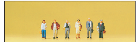
80913 Flugreisende Travellers