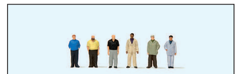
80916 Stehende Männer Standing men