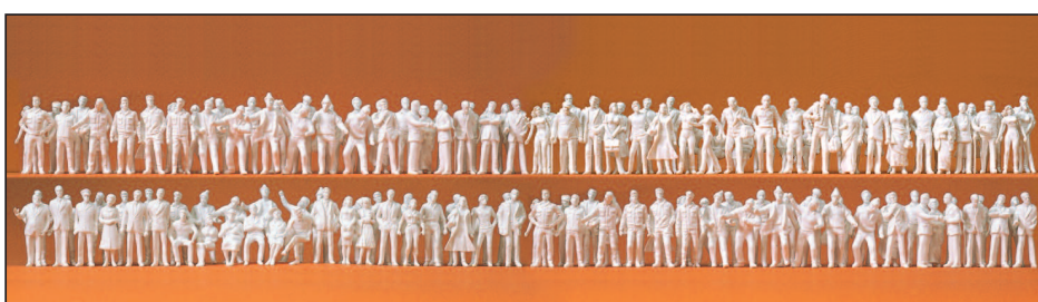
80990 190 unbemalte Miniaturfiguren. Bausatz. Figuren: Materialfarbe weiß 190 unpainted miniature figures. Kit. Figures: Material in white colour