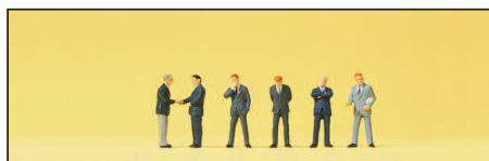
80910 Geschäftsleute Businessmen