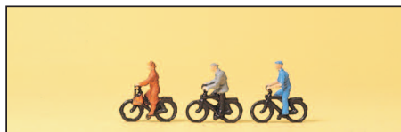
80911 Radfahrer Cyclists

Weitere Miniaturfiguren für den Architekturmodellbau finden Sie auf den Seiten: More miniature figures for architectural modelling you will find on pages: