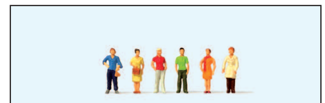
80915 Stehende Frauen Standing women