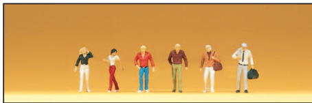
80901 Gehende Passanten Walking passers-by