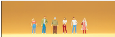
80900 Passanten Passers-by

Miniature figures. 1/200 scale. For architectural modelling. Made of plastic. Carefully hand painted.